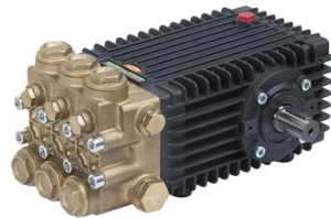
Bomba de Alta Pressão - Uso industrial