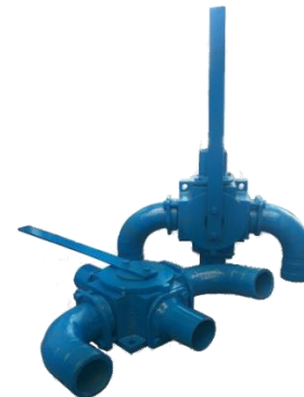
Chave 4 Vias - Usos: Executa a liberação ou oclusão do fluxo de dejetos no tanque.