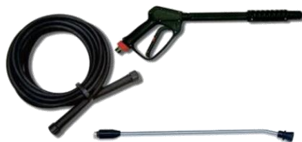
Pistola de Alta Pressão - Uso industrial