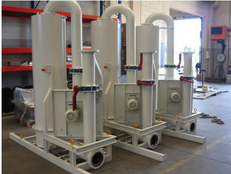
FILTRO ELIMINADOR DE NÉVOA – AWS ITÁLIA