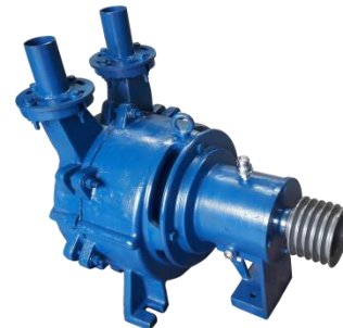
Bomba de Vácuo - Uso industrial