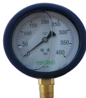
Manômetro - Material: Aço ou inox. - Usos: Identificar a capacidade da bomba, o aumento de pressão de linha, a válvula reguladora de pressão, a operação da válvula de reforço de linha e pressões de linha mínima e máxima.