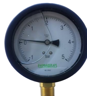
Manovacuumetro - Material: Aço ou inox. - Usos: Medidor de bombas das máquinas, indicando se a pressão de aspiração é positiva ou negativa.