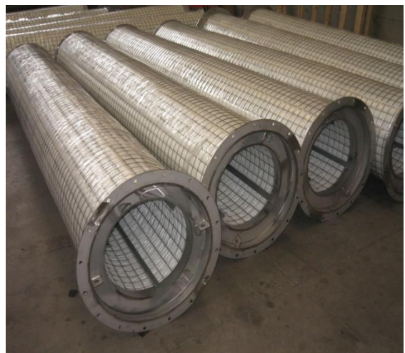
PRECIPITADOR ELETROSTÁTICO ÚMIDO – AWS ITÁLIA